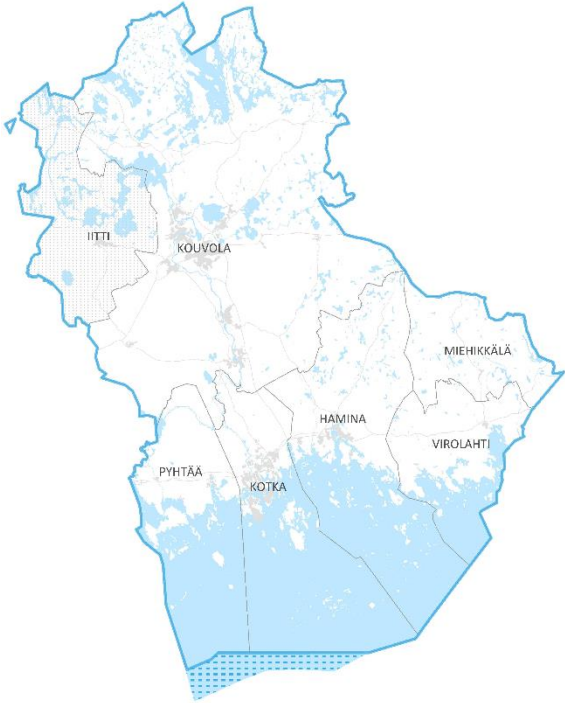
Kuva 2. Maakuntaohjelman suunnittelualue. Iitti liittyy Päijät-Hämeen maakuntaan 1.1.2019. Merialuesuunnittelun myötä pohditaan myös talousvyöhykkeen kestävää hyödyntämistä.

Maakuntaohjelman suunnittelualueena on Kymenlaakson maakunta ja valmisteltavan merialuesuunnittelun myötä myös talousvyöhyke.