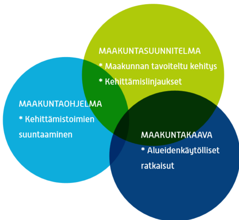
Kuva 1. Aluepoliittisen lainsäädännön määrittämä suunnittelujärjestelmä maakunnallista aluekehitystyötä varten.

Maakuntien liittojen uudeksi tehtäväksi on maankäyttö- ja rakennuslaissa (§ 19) linjattu merialuesuunnitelmien laatiminen vuoteen 2021 mennessä. Merialuesuunnittelun tarkoituksena on edistää merialueen eri käyttömuotojen kestäväää kehitystä ja kasvua, merialueen luonnonvarojen kestäväää käyttöä sekä meriympäristön hyvän tilan saavuttamista. Merialuesuunnitelma laaditaan aluevesille ja talousvyöhykkeelle.