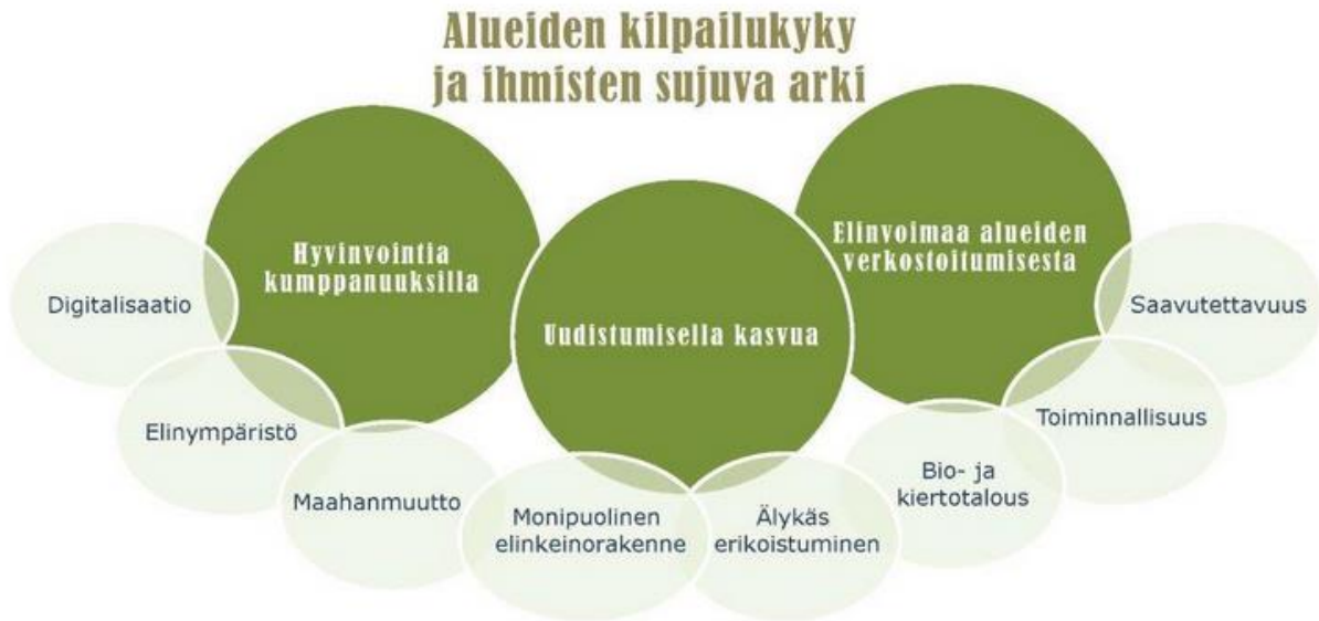
Kuva 1. Valtakunnalliset alueiden kehittämisen painopisteet 2016-2019.